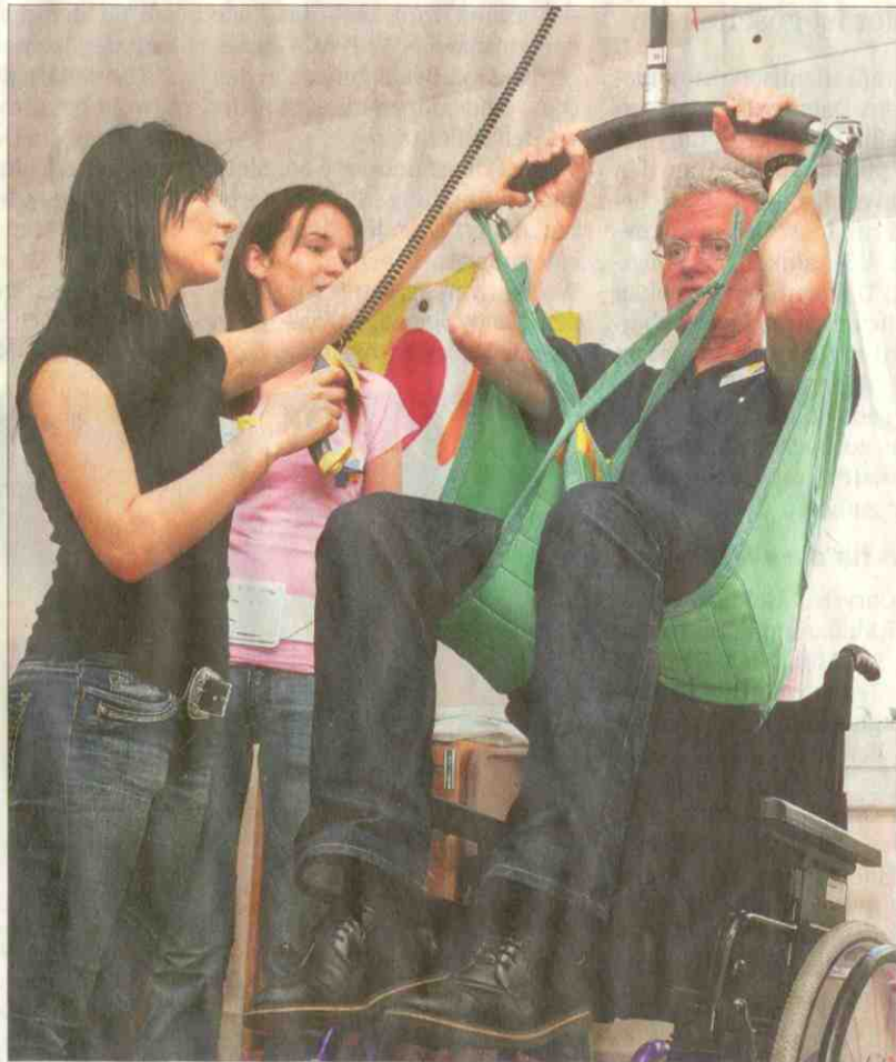
Das Bärenmoos-Personal demonstrierte seine anspruchsvolle Pflege-Tätigkeit vor Ort. (André Springer)

Grusskarten sind auch erhältlich im Internet unter www.baerenmoos.ch .