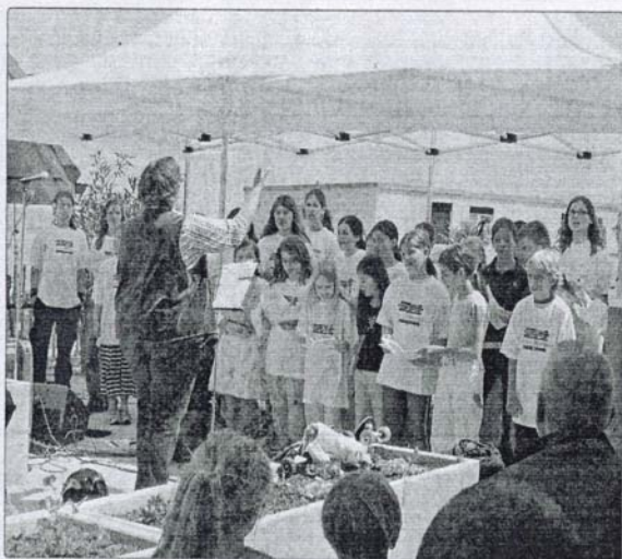
Der Schulchor Oberrieden welkte die neue Dachterrasse bei strahlendem Sonnenschein gesanglich ein. Erika Wartmann

Informationen zum Wohnhaus Bärenmoos: www.baerenmoos.ch ; PC 87-117246-3.